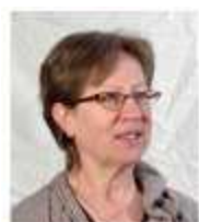
Rika Van Dycke Kezelbergstraat, 1 8200 Zedelgem

De stijl van haar werken kreeg een heel persoonlijk accent. De vormen komen immers natuurlijk aan, vanzelf opborrelend uit een rijk onderbewustzijn. Ook de versieringen met oxides, sulfaten en engobes zijn sober geïntegreerd. Stukjes ijzer geven de werkjes een zekere speelse tederheid... Een vaste waarde voor ons Vlaams kunstbezit.