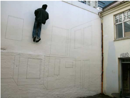
Site content © Darri Lorenzen