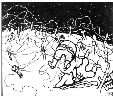
Félix Vallotton, Barbelés.

Kwamen ook in aanmerking: Vivaldi, Vaughan-Williams, Villa-Lobos