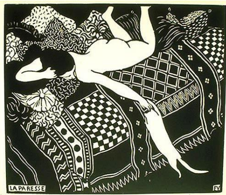
Félix Vallotton, La Paresse.

stonden op vinyl gegraveerd, het was de eerste box van dit formaat die ik ooit voor mezelf gekocht had (of van mijn ouders gekregen), en door die zwarte schijven grijs te draaien is Vieuxtemps nr. 5 op die manier spontaan tot mijn eigen luisterrepertoire gaan behoren.