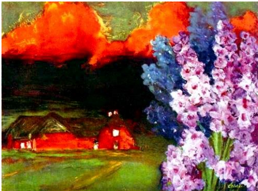
Emil Nolde, Zwoele avond (1930)

Nolde, dat was liefde op het eerste gezicht. Echt. Ik heb hem eerder laat ontdekt, een schilderij van hem in het museum Ludwig in Keulen trok ooit mijn aandacht. Ik denk dat het 'Zwoele avond' was, maar zeker weet ik dat niet meer. Hoe dan ook: je herkent de hand van de kunstenaar onmiddellijk: felle, forse kleurvlakken, vaag begrensde objecten, vervormde werkelijkheid,