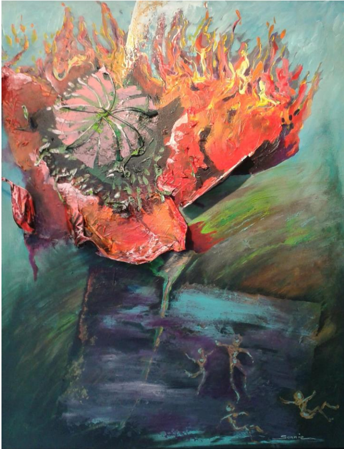
Rozen na de klap!